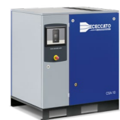
Versione montata a pavimento