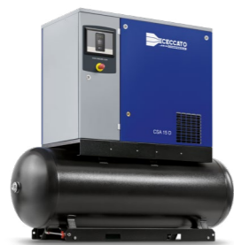
Versione montata su serbatoio con essiccatore integrato